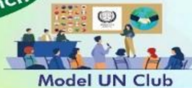
Model UN Club