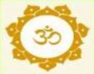
TFAS - Vedic Vigyan Utsav 2024