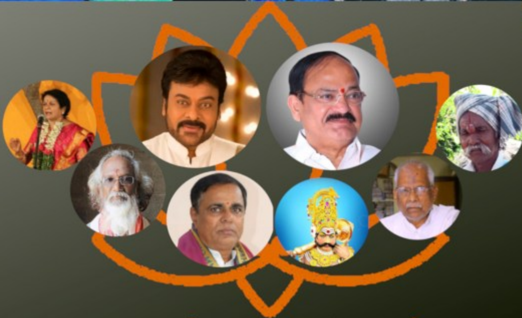
విరిసిన తెలుగు పద్యాలు!