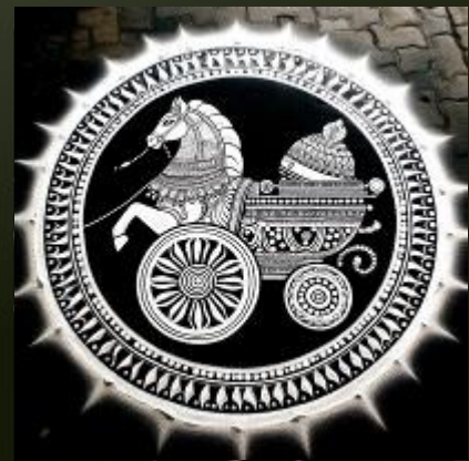
రథం ముగుట - AI ఊహ లో!